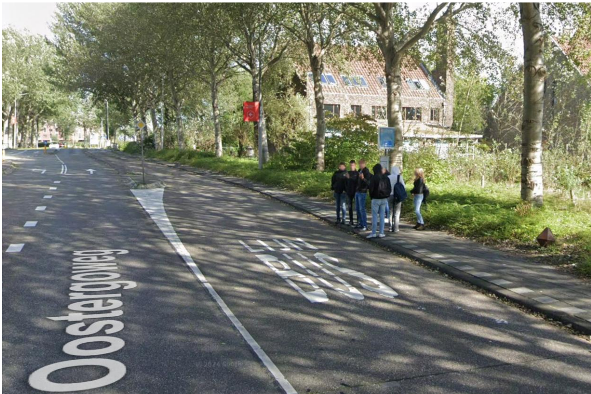
Huizumerlaan (bij van Hall): aanrijroute, geen voorzieningen, staat van onderhoud

In het genoemde beleidskader staat daar ondanks het STOMP principe niets over vermeld. Graag zien we dat dit onderwerp opgenomen wordt in het college akkoord.