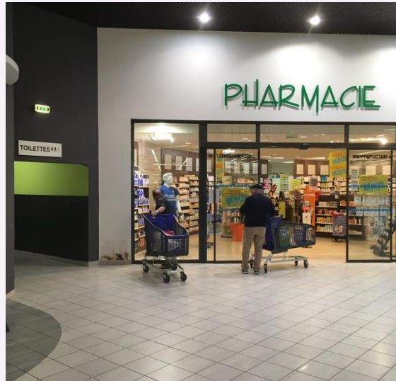
Klein winkelcentrum, Frankrijk

Ook bij supermarkten en buurtwinkelcentra (in Nederland een uitzondering)