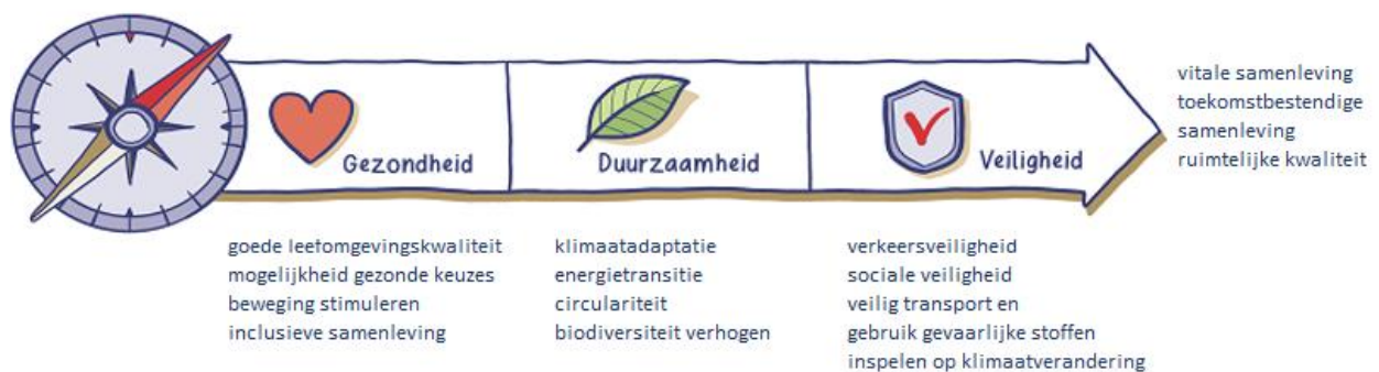
Figuur 3: Het kompas

Randvoorwaarde bij het behalen van deze doelen is een vitaal en leefbaar Vijfheerenlanden. Dit vertalen we naar een gezonde, duurzame en veilige leefomgeving. Bij het realiseren van de doelen houden we het behoud van een vitale samenleving aan als kompas. Het geeft ons richting bij het bereiken van onze doelen. De thema's gezondheid, veiligheid en duurzaamheid zijn daarom een belangrijke rode draad in alle omgevingsprogramma's. In onderstaande figuur is weergegeven wat we verstaan onder deze begrippen binnen het kader van de omgevingsvisie.