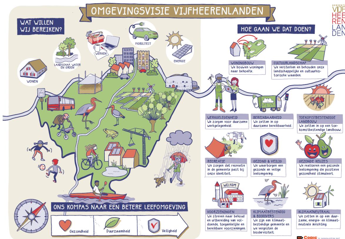
figuur 1: Samenvatting van de omgevingsvisie Vijfheerenlanden

In 2040 is het goed leven in Vijfheerenlanden. Vijfheerenlanden wordt gekenmerkt door een groen hart met rust en ruimte met hoge natuur- en cultuurhistorische waarden, waar inwoners en bezoekers genieten van ruimte en landschap. Dorpen en steden bieden een veilige, duurzame leefomgeving met voorzieningen dichtbij, sterke betrokkenheid van inwoners en schone energie. Het buitengebied is klimaatbestendig, biodivers, toegankelijk voor recreatie en biedt ruimte voor duurzame landbouw en lokaal ondernemerschap.