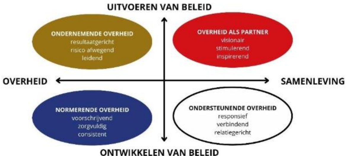
Figuur 4: Gemeentelijke rollen.