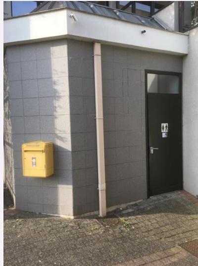
Bessines (2700 inwoners), Frankrijk

Ook in kleine dorpen een openbare wc (in Nederland zelden tot nooit, tenzij ze heel toeristisch zijn)