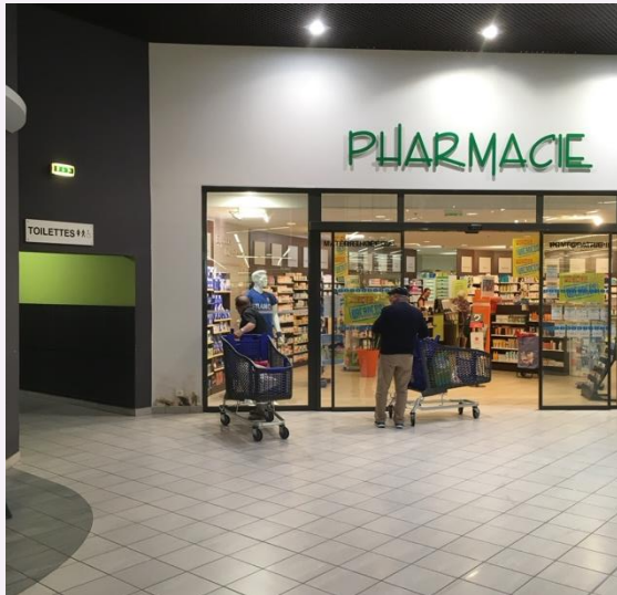
Klein winkelcentrum, Frankrijk

Ook bij supermarkten en buurtwinkelcentra (in Nederland een uitzondering)