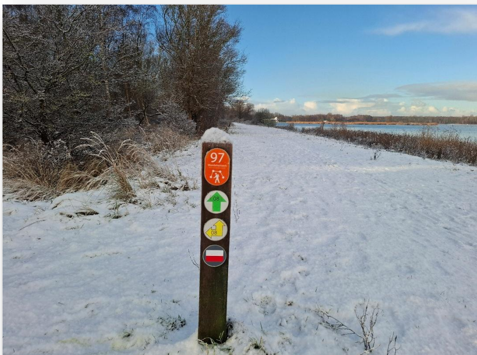
Figuur 5: Wandelroute in de sneeuw