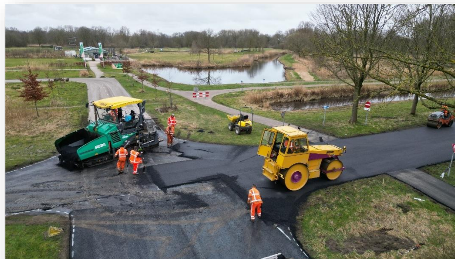
Figuur 7: Groot onderhoud in Het Twiske

Het recreatieschap had geen kosten onvoorzien begroot. Wel is het benodigde weerstandsvermogen bepaald op basis van de risicoparaagraaf.