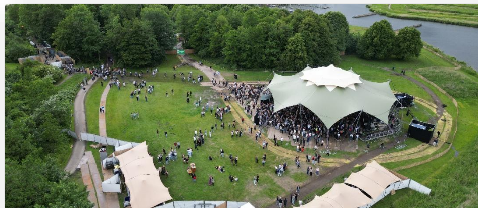
Figuur 6: Festivalgangers bij Lentekabinet

Verder zijn hier de werkzaamheden voor de voor de projecten 'proef vriendelijk ganzenbeheer', 'onderzoek naar de wenselijkheid van zonnepanelen bij de parkeerplaats' en het subsidieproject '2e tranche natuurherstel' opgenomen.