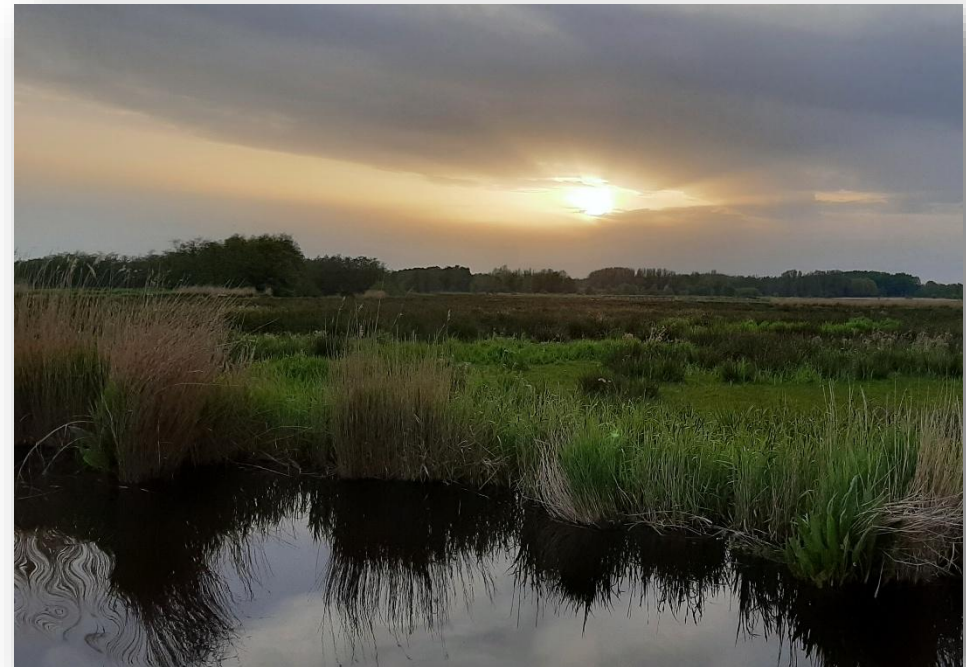
Figuur 9: Deelgebied De Vennen in Het Twiske

Om voldoende baten te verkrijgen uit de gronden, zijn sommige percelen voor commerciële en agrarische activiteiten of bewoning uitgegeven. Bij Recreatieschap Twiske-Waterland is (nog) geen sprake van een vastgesteld grondprijzenbeleid. Wel wordt aangesloten bij marktconforme prijzen in de regio. Bovendien is er sprake van actief accountmanagement en contracten worden regelmatig herzien of gecontroleerd op oneigenlijk gebruik.