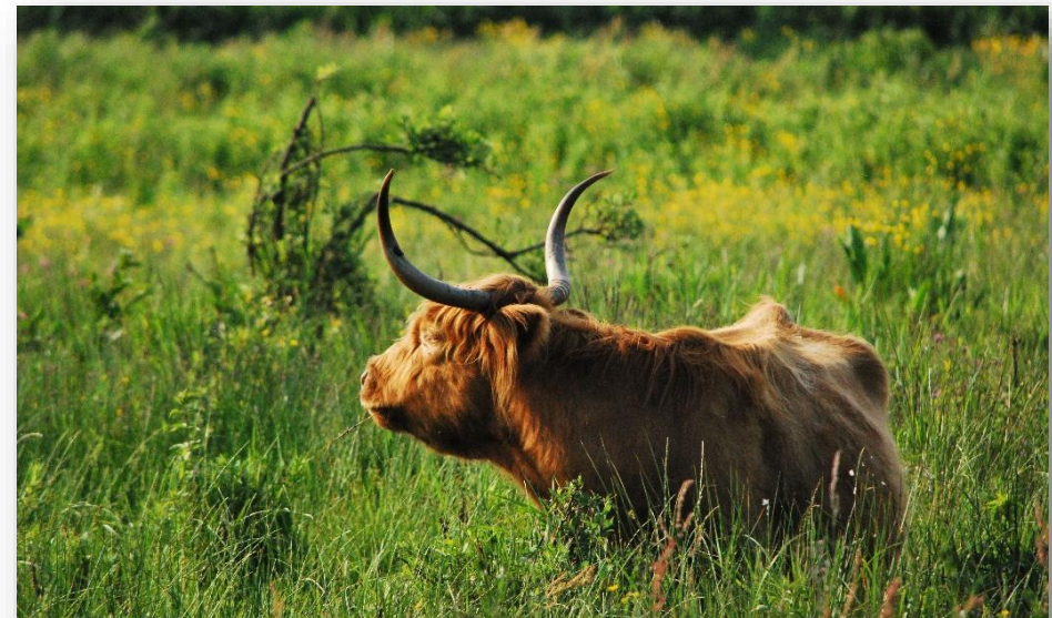
Figuur 1: Schotse hooglander in Het Twiske