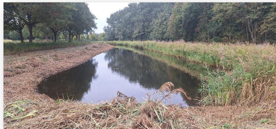
Figuur 3: stimulering van de biodiversiteit door eenzijdig te schouwen langs sloten in Het Twiske

Daarnaast maaien we jaarlijks riet om een gezonde afwisseling van oud, overjarig en nieuw riet in stand te houden. Bij opnieuw inzaaien kiezen we voor kruiden- en bloemenrijke mengsels. Daarmee zorgen we voor voldoende nectar en stuifmeel voor bijen en vlinders. Ook planten we bomen en struiken met ecologische waarde, zoals soorten met bloesem of bessen, en vergroten we de soortenvariatie in het gebied.