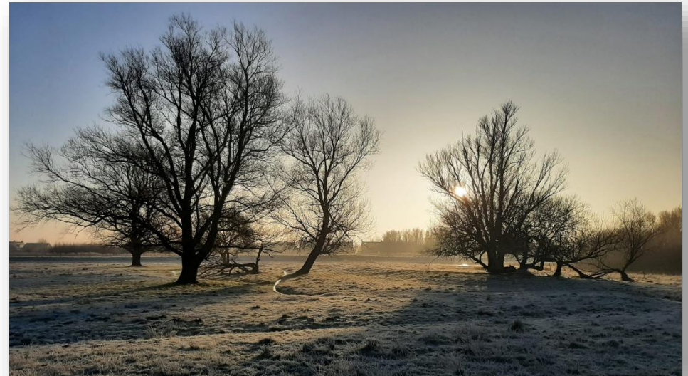
Figuur 10: Het Twiske in de winter

dagelijks bestuur ook beschreven welke actie hij onderneemt om vermelde afwijkingen in de toekomst te voorkomen. welke actie hij onderneemt om vermelde afwijkingen in de toekomst te voorkomen.