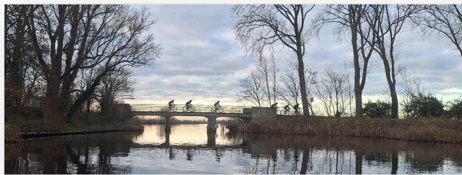
Figuur 4: Wielrenners over een brug in Landschap Waterland

Het recreatieschap pakt ook haar maatschappelijke rol op. Dit doen we door maatschappelijk verantwoord ondernemen onderdeel te laten zijn van onze bedrijfsvoering. Zo blijven we in 2025 stageplaatsen bieden aan studenten van groene opleidingen. Twiske Waterland biedt ook in samenwerking met regionale partners, kansen aan mensen met een afstand tot de arbeidsmarkt. Dit kwam in 2025 opnieuw tot uiting in de samenwerking met Werkom.