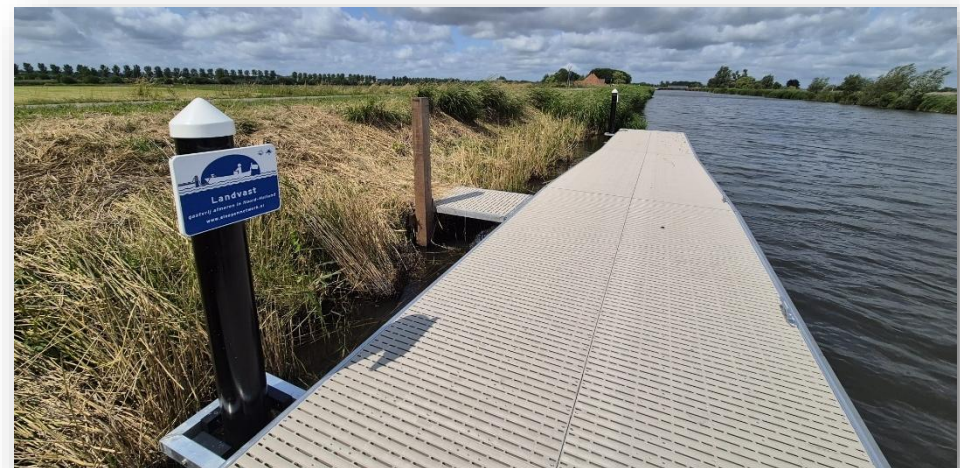
Figuur 2: Een nieuw gerealiseerde landvastlocatie inclusief bebording

Door het uitbreiden en verbeteren van openbare voorzieningen (landvasten) voor de kleine recreatievaart (sloepen, fluisterboten, kano's en SUP's) wordt het sloepennetwerk verstrekt. De landvastlocaties zijn duidelijk herkenbaar door blauwe bebording in de openbare ruimte. Daarnaast zijn de locaties als point of interest (POI) op de online-routekaarten te vinden. In 2025 zijn er drie nieuwe openbare aanlegsteigers gerealiseerd. Daarnaast zijn er elf bestaande aanlegsteigers en twee loswal locaties van HHNK in de regio Laag-Holland omgevormd naar landvasten.