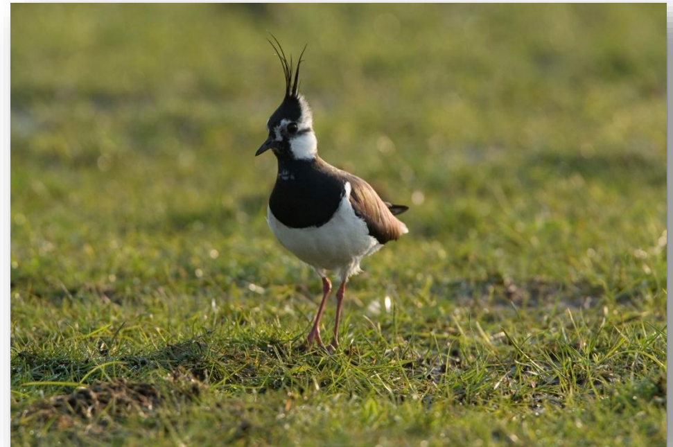
Figuur 8: Kievit in Waterland