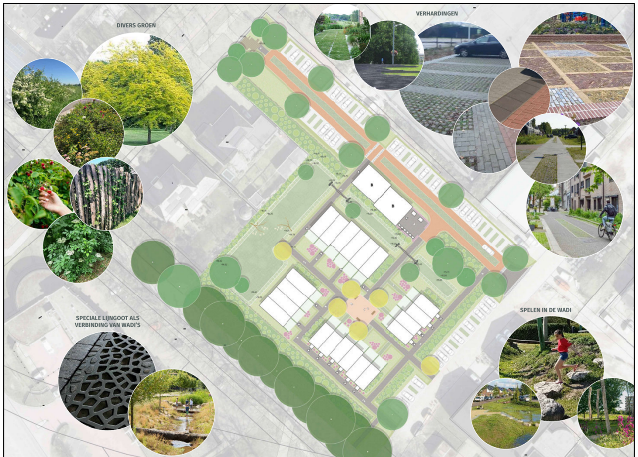
Figuur 2 - Inrichtingsplan Borculo