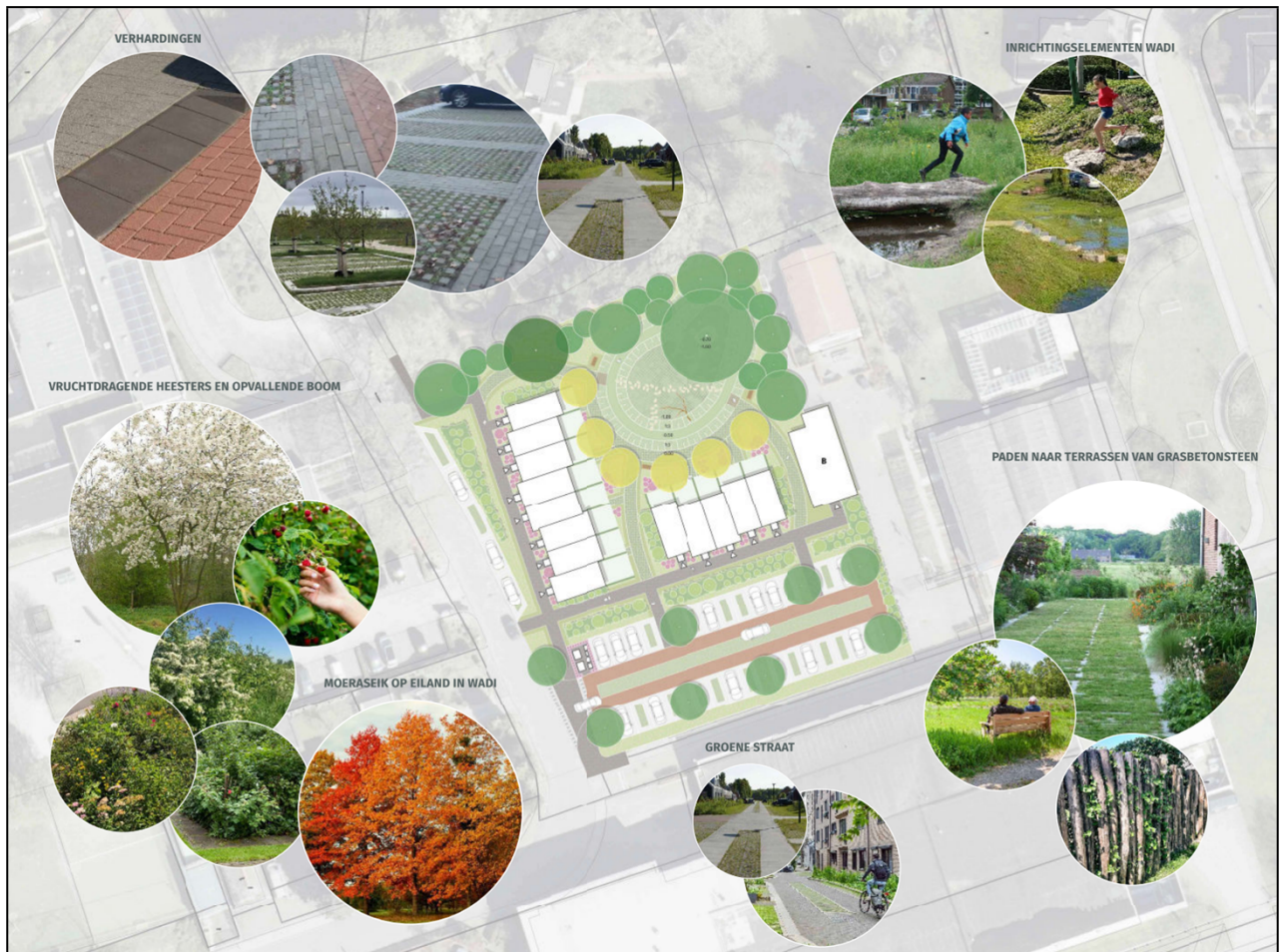
Figuur 3 - Inrichtingsplan Neede