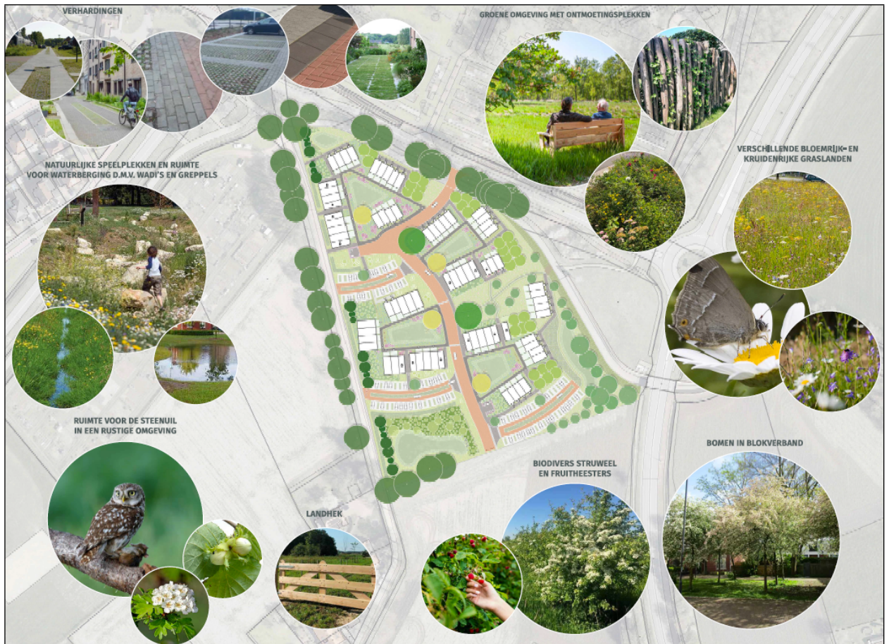
Figuur 4 - Inrichtingsplan Ruurlo