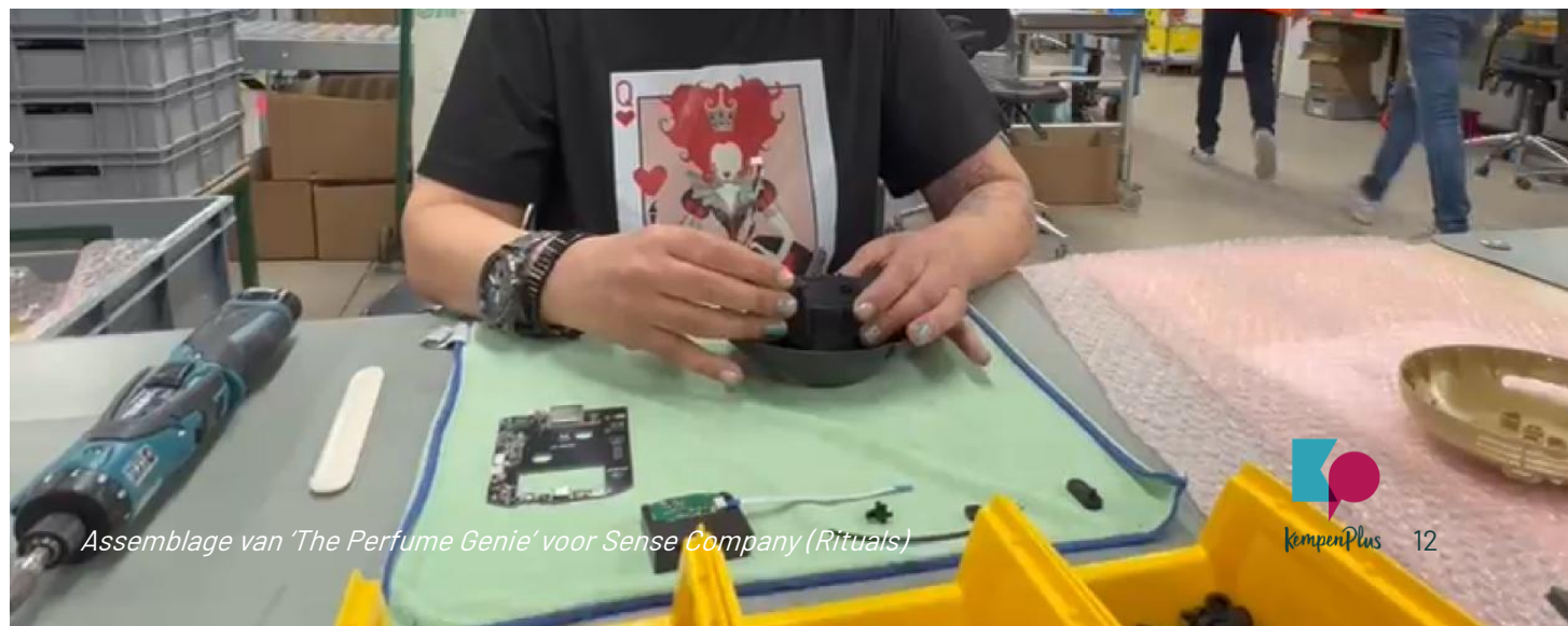
Assemblage van 'The Perfume Genie' voor Sense Company (Rituals)