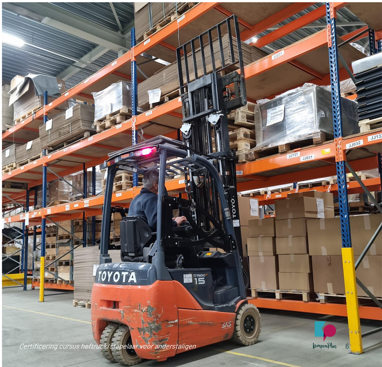
Certificering cursus heftruck/stapelaar voor anderstaligen

Tot slot is gewerkt aan een nieuwe verdeelsleutel en wordt een bijdragebesluit opgesteld, dat in het 1 e kwartaal van 2026 in routing wordt gebracht. Daarbij wordt de gemeenteraden van de deelnemende gemeenten om een zienswijze gevraagd. Op basis daarvan wordt ook de kostenverdeling per gemeente gemaakt.