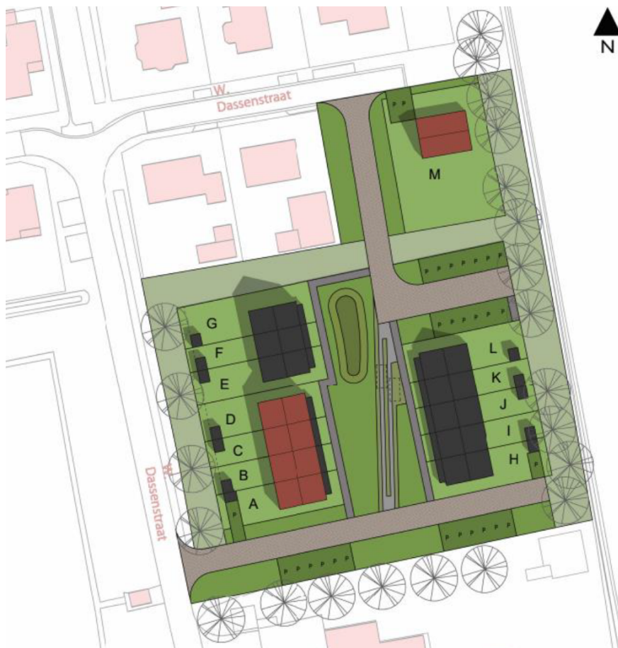
Afbeelding 3: Situatieschets stedenbouwkundig plan