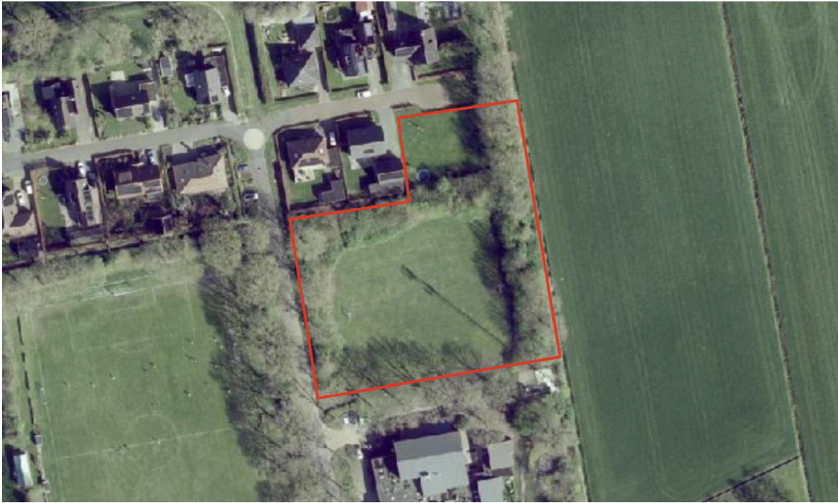
Afbeelding 2: Plangebied op de luchtfoto