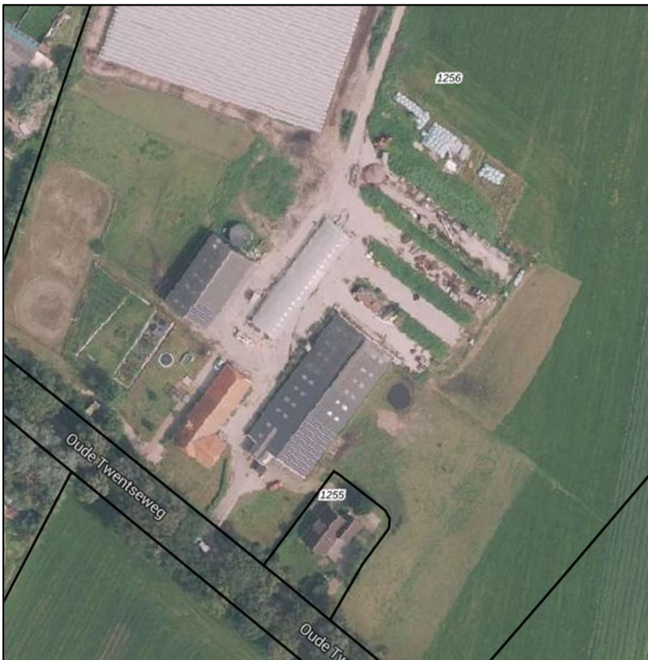
Figuur 2 weergave locatie

Aan de zuidzijde en voor de woningen bevinden zich een aantal hagen, die behouden blijven met dit plan. De locatie wordt via een inrit ontsloten op de Oude Twentseweg. Beide woningen hebben daarnaast iedere hun eigen inrit.