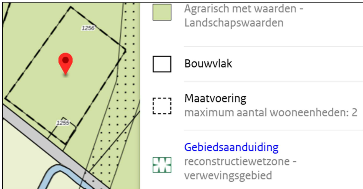
Figuur 3 weergave bestaande planologische situatie

Vanaf 1 januari 2024 is het toenmalige bestemmingsplan 'buitengebied Raalte' (vastgesteld 8 juni 2012) opgegaan in het (tijdelijke deel van) Omgevingsplan van de gemeente Raalte. In dit voormalige bestemmingsplan kent het plangebied de bestemming 'Agrarisch met waarden - Landschapswaarden' met gebiedsaanduiding 'reconstructiewetzone – verweingsgebied' (zie figuur 3).