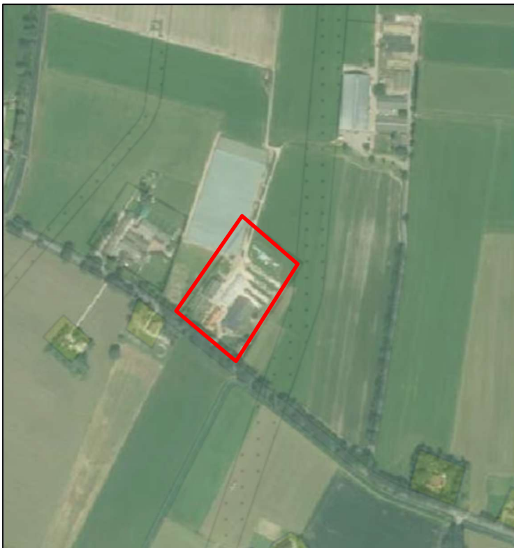
Figuur 1 Ligging locatie t.o.v. directe omgeving

De locatie is gelegen in het buitengebied van Luttenberg. De locatie is kadastraal bekend onder gemeente Raalte, sectie O, nummers 1256, en heeft een totale oppervlakte van 15.050 m 2 . De kern van Luttenberg ligt op een afstand van circa 1 km in zuidoostelijke richting. De locatie wordt aan de zuid- zuidwestzijde begrenst door de Oude Twentseweg. Aan de overige zijden wordt de locatie begrenst door agrarische gronden met landschapswaarden. Hieronder een weergave van de locatie.