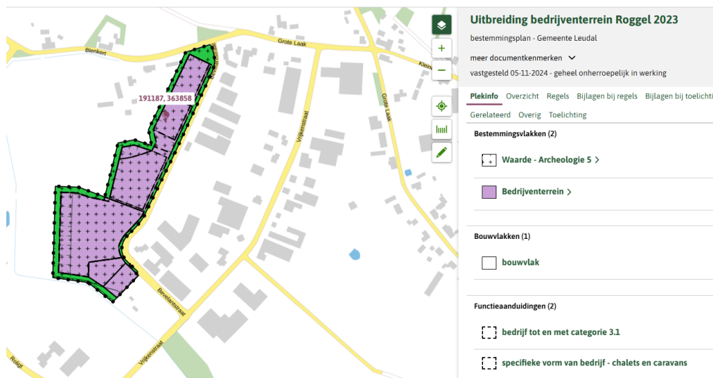
Uitbreidingsgebied bedrijventerrein Roggel

Op 5 november 2024 heeft uw raad van Leudal het bestemmingsplan "Uitbreiding bedrijventerrein Roggel 2023" vastgesteld. Dit ruimtelijk plan voorziet in de uitbreiding van het bedrijventerrein in Roggel. De uitbreiding is gelegen aan de Bevelantstraat, zie onderstaande afbeelding. Het bestemmingsplan is inmiddels geheel onherroepelijk en in werking getreden.