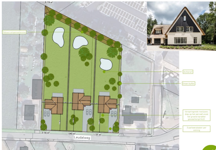
Verkaveling en beoogde vormgeving woningen