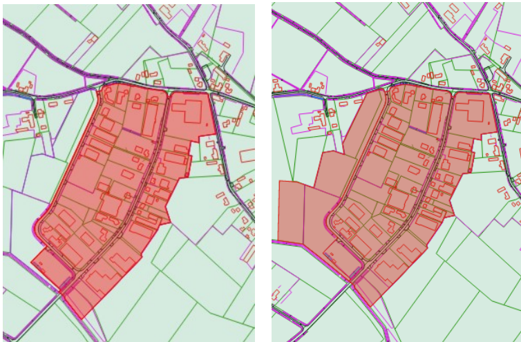
Huidige en nieuwe welstandsvrij gebied bedrijventerrein Roggel (rode kleur is welstandsvrij)

De uitbreiding van het bedrijventerrein aan de Bevelantstraat in Roggel sluit aan bij het bestaande bedrijventerrein van Roggel. Dit bedrijventerrein is gelegen in een welstandsvrij gebied. Door de uitbreiding ook welstandsvrij te maken, ontstaat een eenduidig welstandsbeleid voor deze locatie. Het aangepaste welstandsgebied van de Bevelantstraat is als bijlage 1 bij dit advies opgenomen.