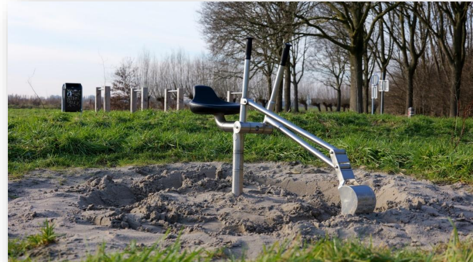
Figuur 4: Graafmachine bij de Uitkijktoren Het Poldernest te Ouder-Amstel