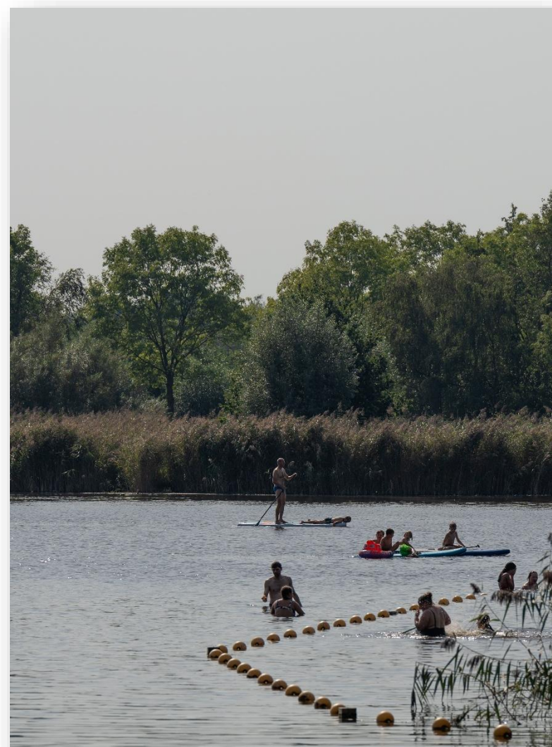
Figuur 5: Recreëren bij de Hoge Dijk te Amsterdam

De maatschappelijke vervangingen zien op het opwaarderen/uitbreiden van de toiletgebouwen. De geplande economische vervanging in 2029 ziet op de vervanging van een auto.