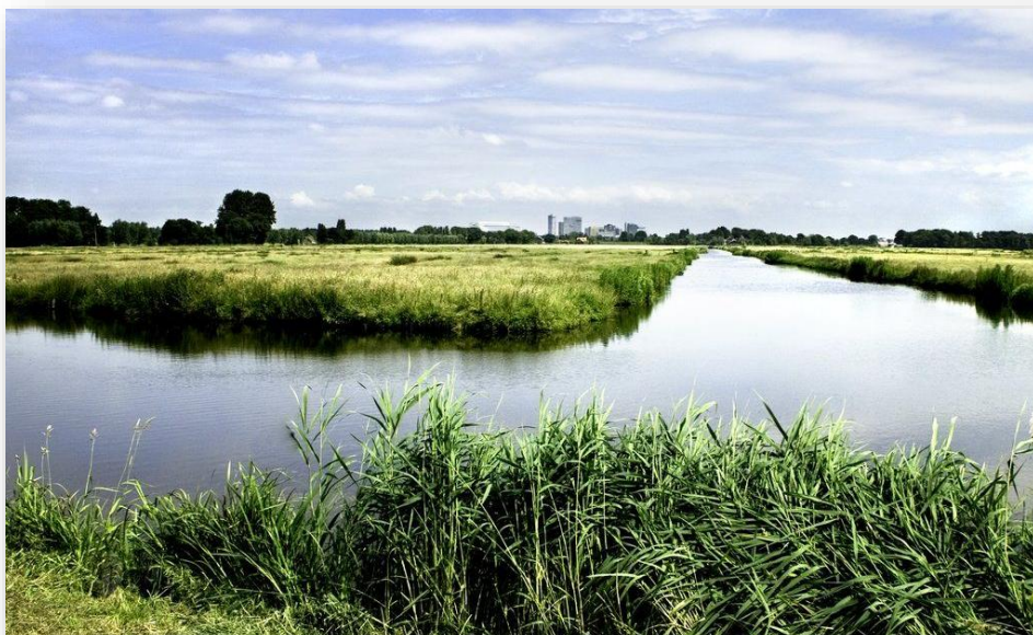
Figuur 3: Uitzicht op de Middelpolder te Amstelveen