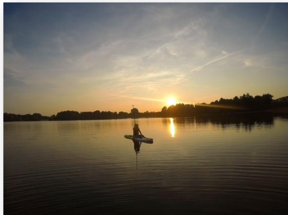
Figuur 2: Suppen op de Gaasperplas te Amsterdam

De kwantificering van de risico's leidt tot een gewenst weerstandsvermogen van € 531.250,-. De huidige weerstandscapaciteit ligt boven het niveau van de berekende risico's.