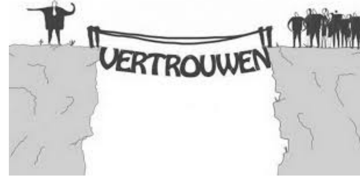
Vormen van participatie