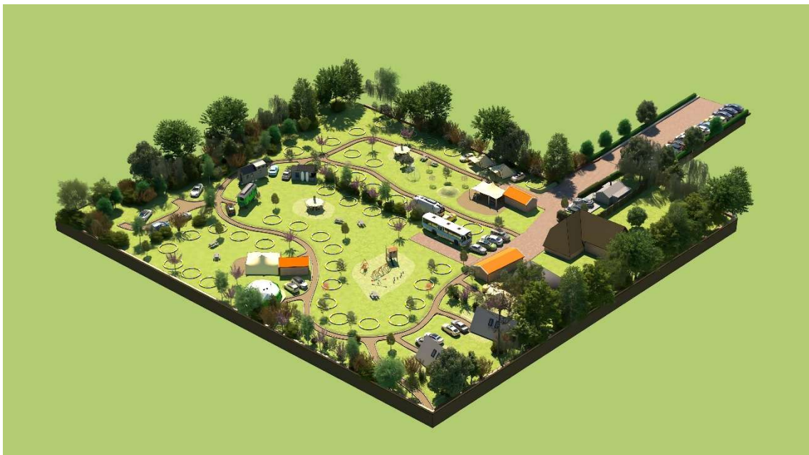
Afbeelding 6: Nieuw ontwerp voor het kampeerterrein van Terra Incognito

Langs de zuidgrens van het terrein is parallel aan de Rijkstraatweg een houtwal aanwezig. De houtwal bestaat uit een mix van onder andere zomereik ( Quercus robur ), zwarte els ( Alnus glutinosa ), schietwilg ( Salix alba ) en veldesdoorn ( Acer campestre ). Door de houtwal zal de camping niet zichtbaar zijn vanaf de Rijkstraatweg.