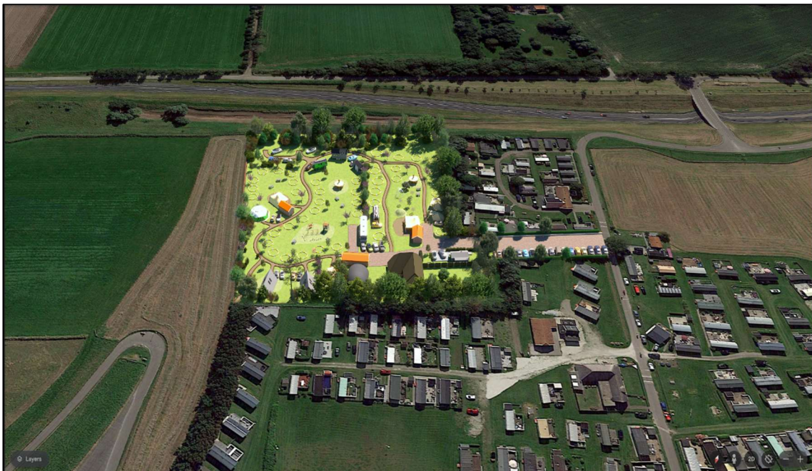
Afbeelding 2: Luchtfoto met Camping Terra Incognito ingetekend in het landschap

Camping Terra Incognito bevindt zich op de noord westelijke punt van Wieringen in het buurtschap Dam in de nabijheid van de Waddenzee. De camping is, met een lange oprijlaan, gelegen aan Dam 7 te Westerland. De naam Terra Incognito verwijst naar de verscholen ligging van het kampeerterrein achter de campingparken Wad Zout 't aan de westzijde en Zeezicht aan de noordzijde. De oostelijke grens ligt langs de dijk. De Rijksweg (N99) loopt aan de zuidzijde iets verdiept langs het terrein.