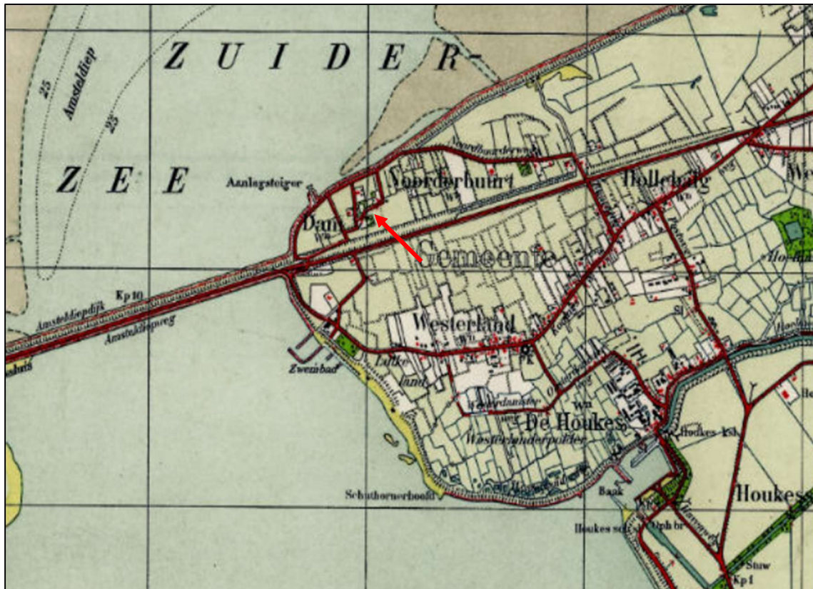
Afbeelding 3: Kaart van 1935 met aansluiting van de Amsteldiepdijk en de Wieringermeerpolder De rode peil geeft de oude weg en huidige oprit van de camping aan ( www.topotijdreis.nl )

Op de kaart van 1936 zijn veel veranderingen zichtbaar ten opzichte van 1920. De Amsteldiepdijk is aangelegd en komt nabij de camping aan land. De Rijksweg loopt van west naar oost over Wieringen, achter het kampeerterrain langs in de richting van Den Oever. Parallel aan de Rijksweg is ter hoogte van de camping een diepe geul gegraven voor de aanleg van een spoorlijn welke nooit is gerealiseerd. Ook is op deze kaart een weg zichtbaar die nu gedeeltelijk fungeert als oprit van de camping.