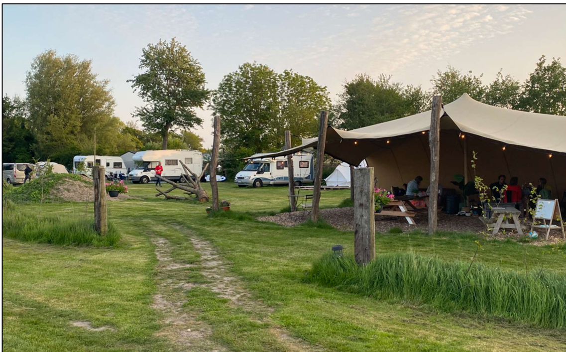
Afbeelding 1 Kamperen bij Terra Incognito

Het beeldkwaliteitsplan dient inzicht te geven in hoe bestaande landschapselementen samen met nieuw toe te voegen landschapselementen zorgen voor een inpassing van het kampeerterrein in de omgeving.