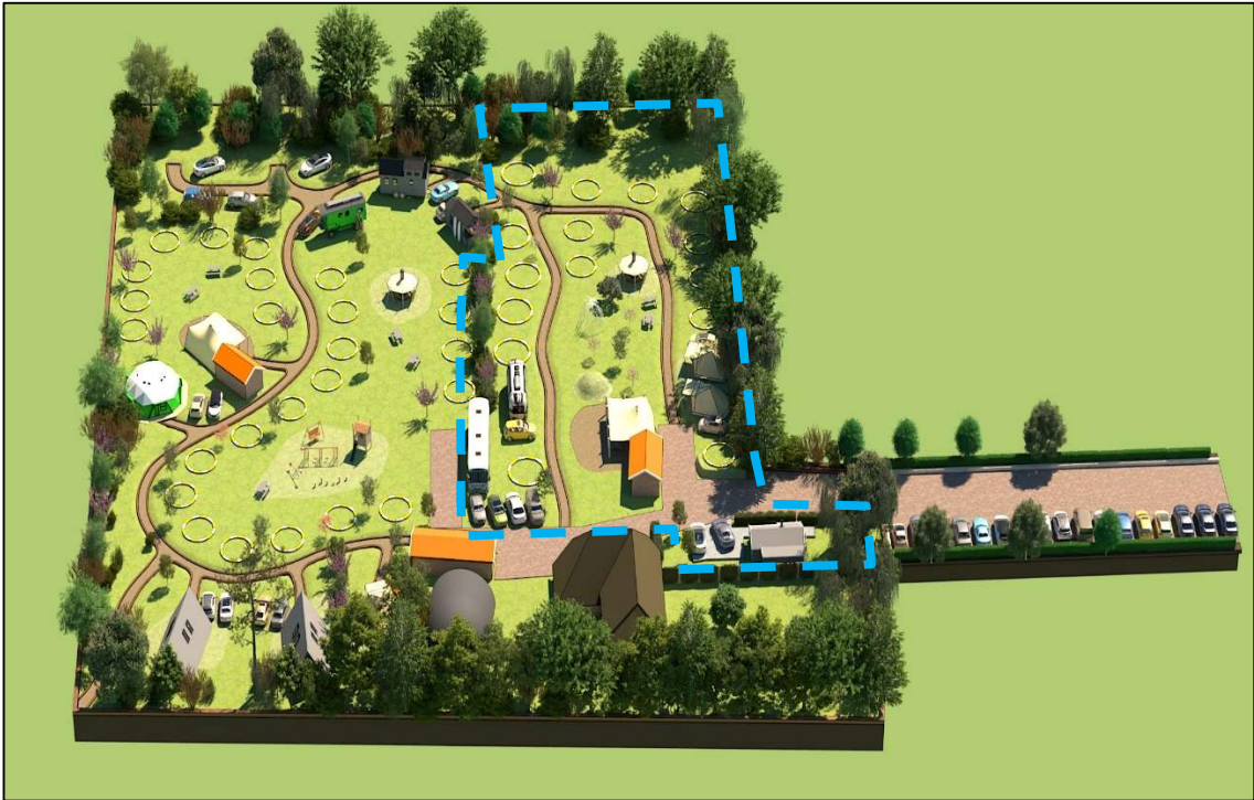
Afbeelding 3: Sfeerontwerp met het reeds gerealiseerde deel van de camping binnen de blauwe stippellijn .

Op het kampeerterrein zijn een sanitairgebouw aanwezig, wordt een stretchtent gebruikt als algemene ruimte en is er een mix van kampeerplekken en tot de camping behorende kampeermiddelen voor de verhuur.