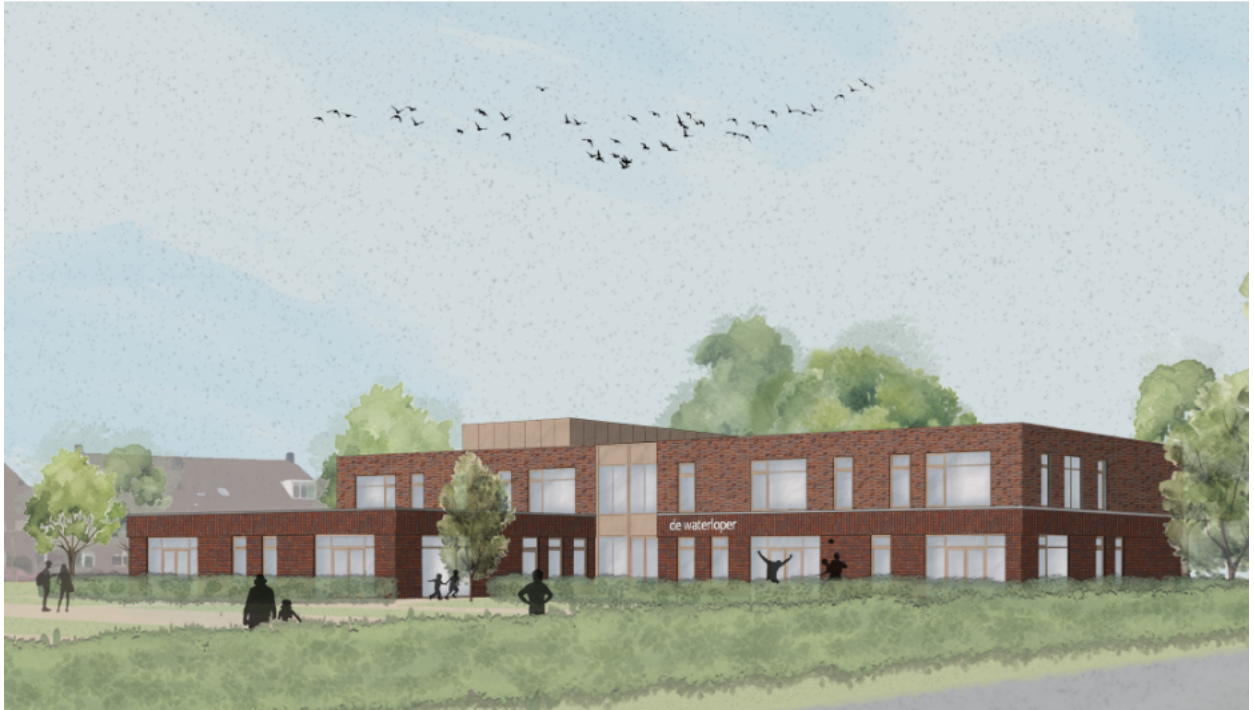
Afbeelding 2: Impressie aanzicht vanaf de Haarsteeg, DO

Dit voorstel heeft betrekking op de controlerende rol van de raad.