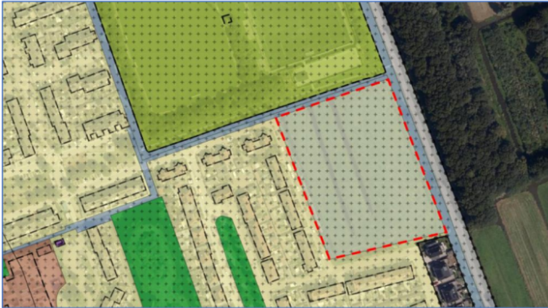
Afbeelding 3 : Uitsnede planlocatie vigerende Omgevingsplan