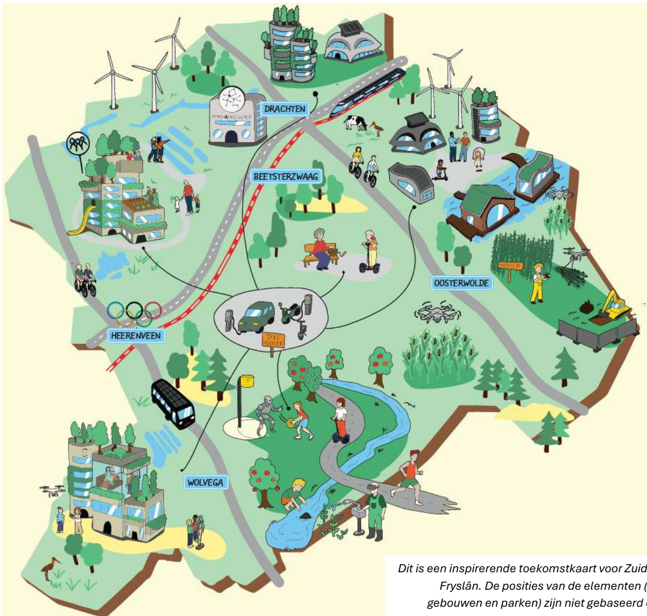
Dit is een inspirerende toekomstkaart voor Zuidoost-Fryslân. De posities van de elementen (zoals gebouwen en parken) zijn niet gebaseerd op de werkelijkheid.