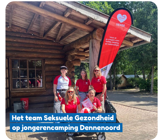
Het team Seksuele Gezondheid op jongerencamping Dennenoord

“We zien dat er de laatste jaren ook veel misinformatie rondgaat op social media, daarom is het extra belangrijk voor de jongeren dat we dit blijven doen.”