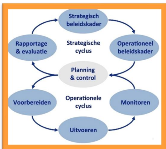
Figuur 1: Big 8

Het evaluatieverslag is het sluitstuk van de beleidscyclus en draagt bij aan een hogere kwaliteit van de VTH-taken. Hieronder een weergave van de volledige VTH-cyclus.