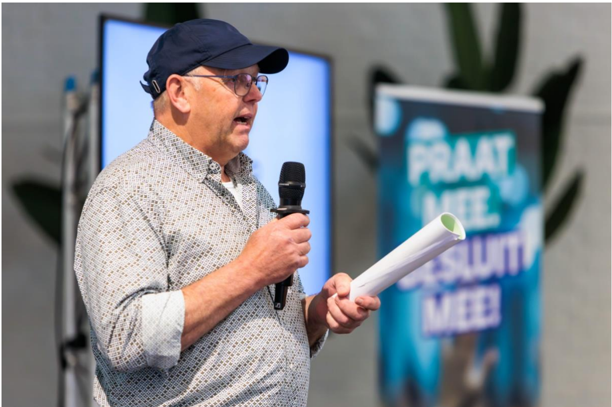
Presentatie van initiatief.