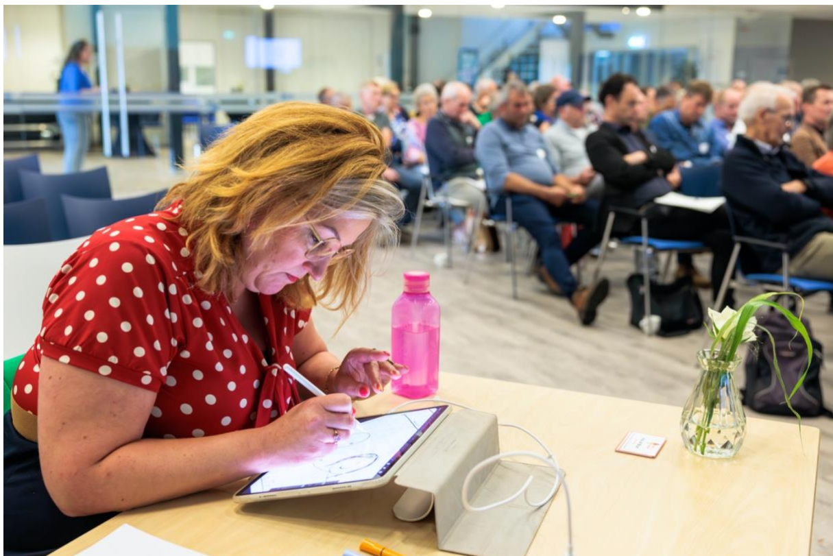
Tekenen tijdens de presentaties..