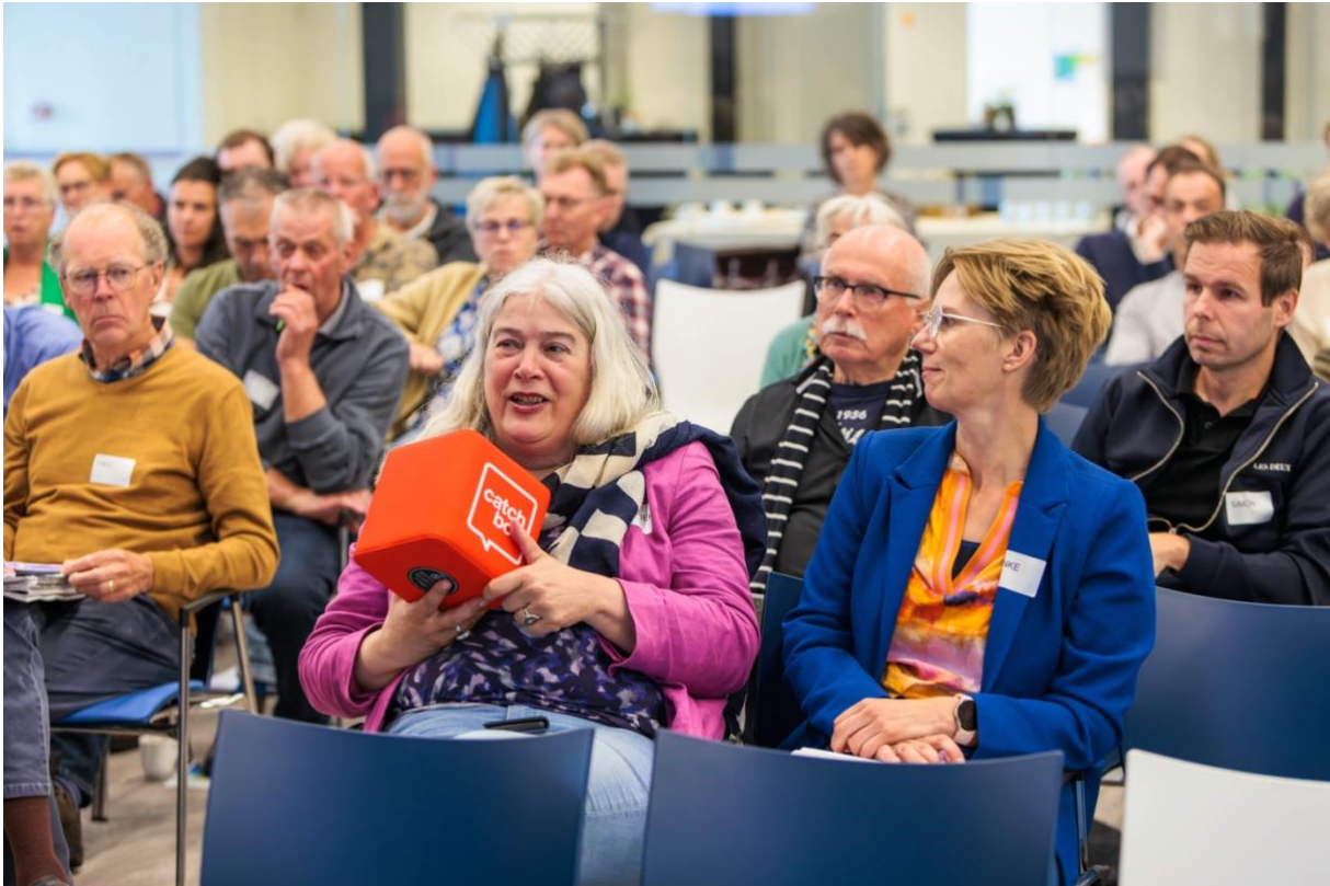
Voor je belang opkomen.