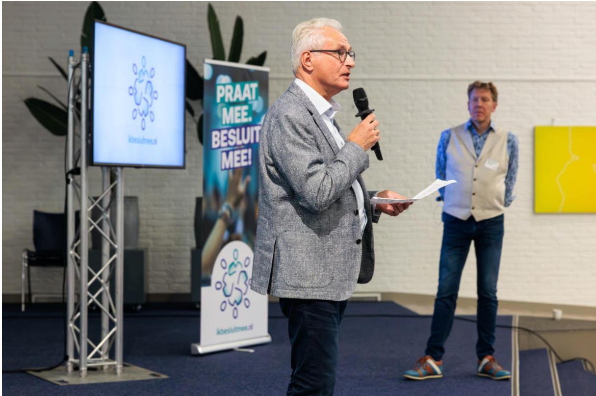
Presentatie van initiatief.