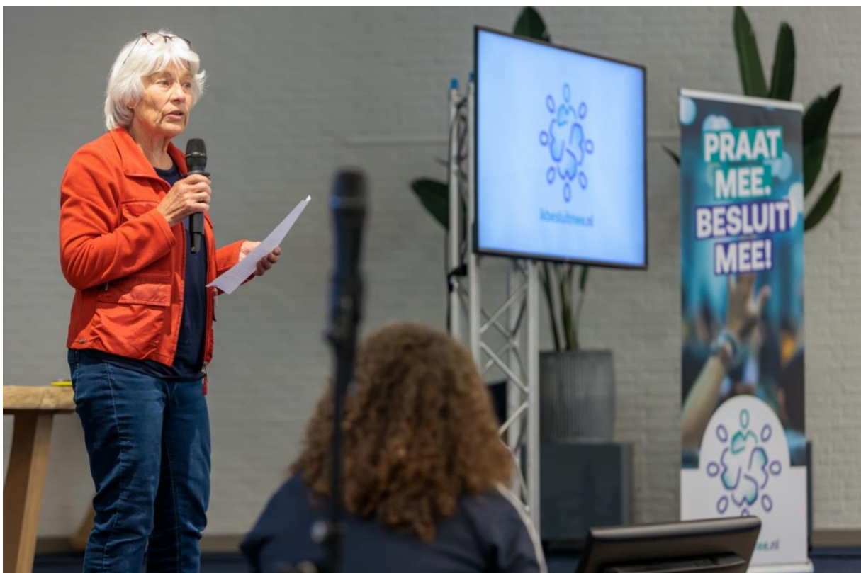
Presenteren van initiatief.