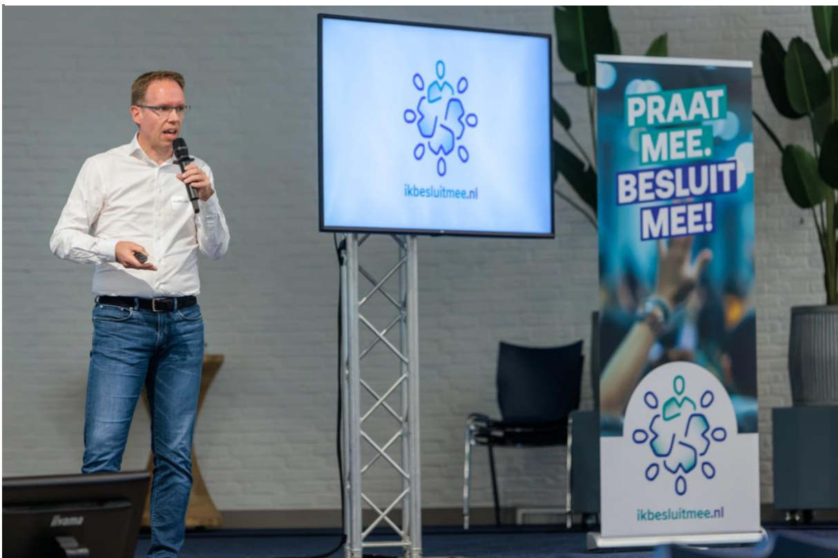
Uitleg over waterkwaliteit en budgetneutraal.