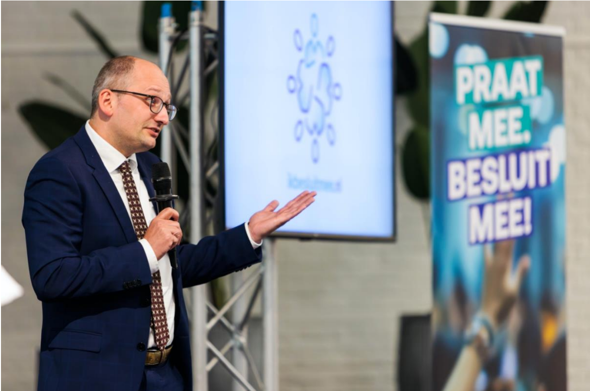
Uitleg over Didam-arrest.