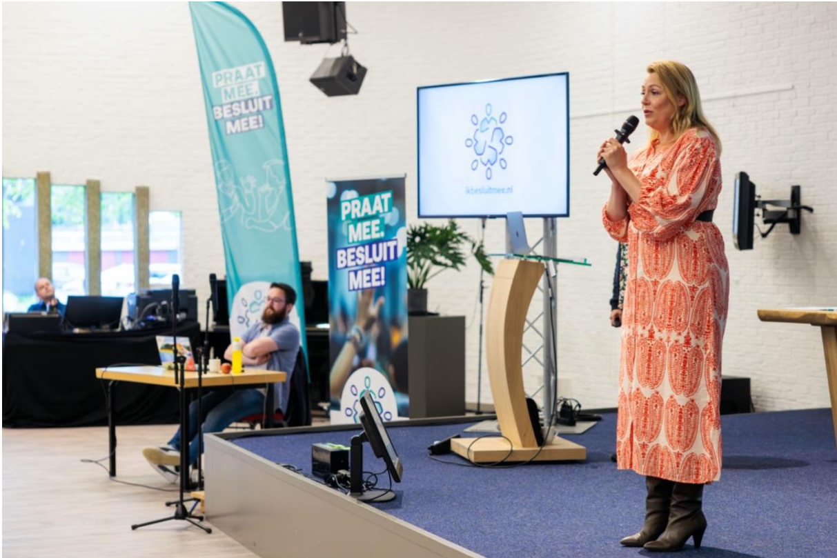
Uitleg van de kaders.