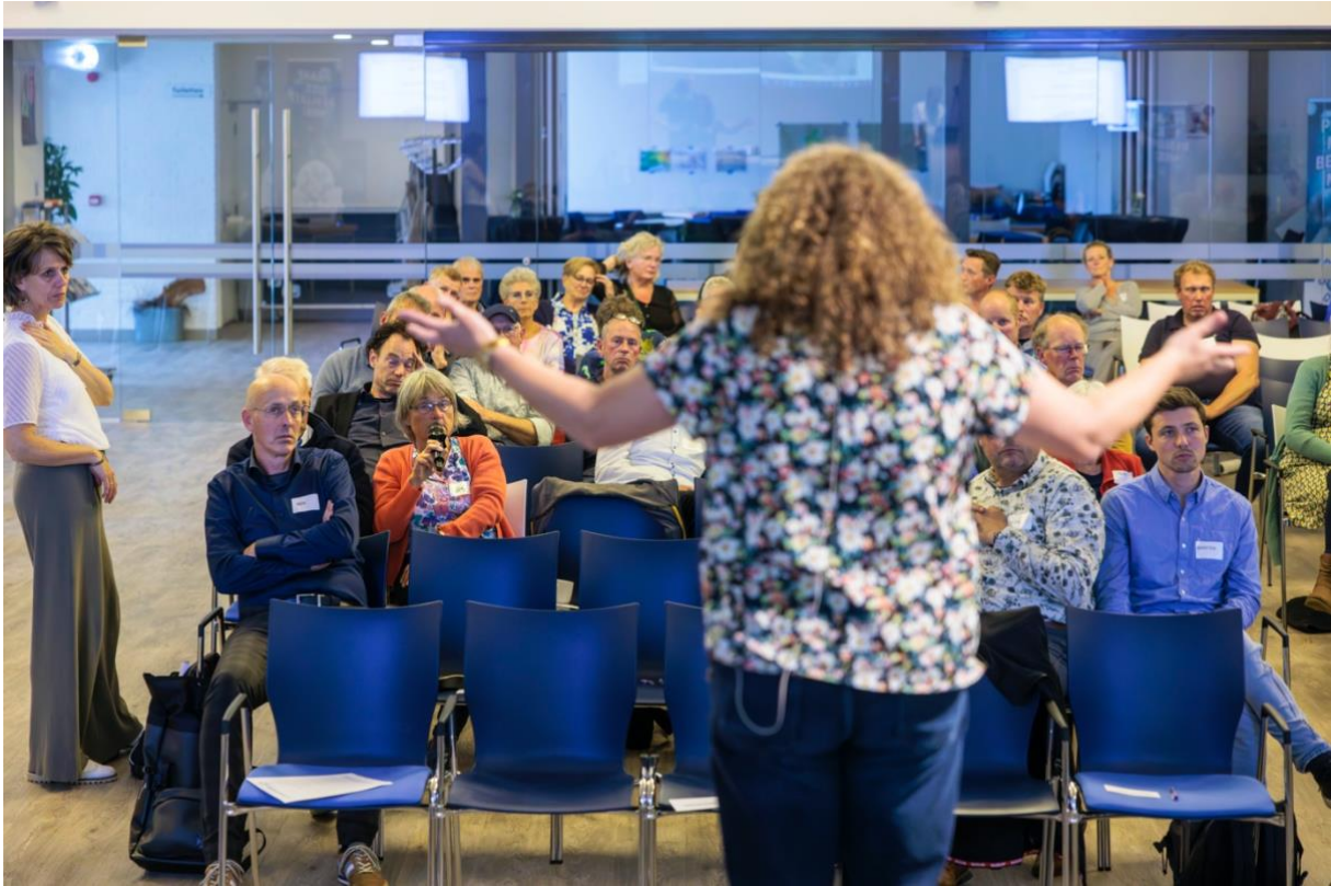
Komen we eruit of niet?