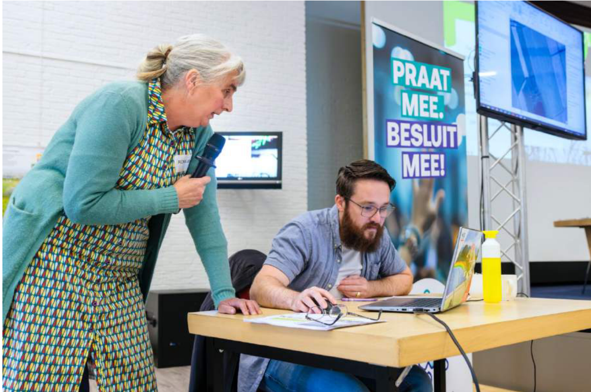
Samen met de tekenaar kijken naar inpassing op de plankaart.