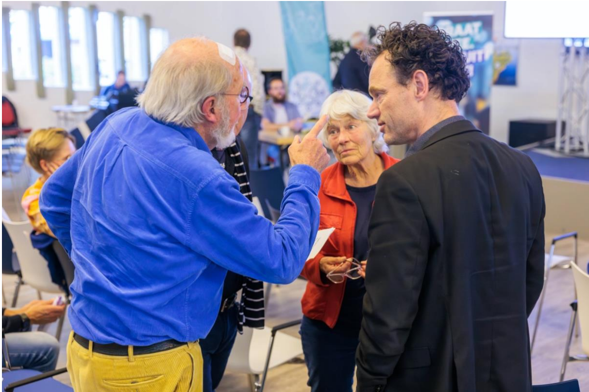
Met elkaar praten.