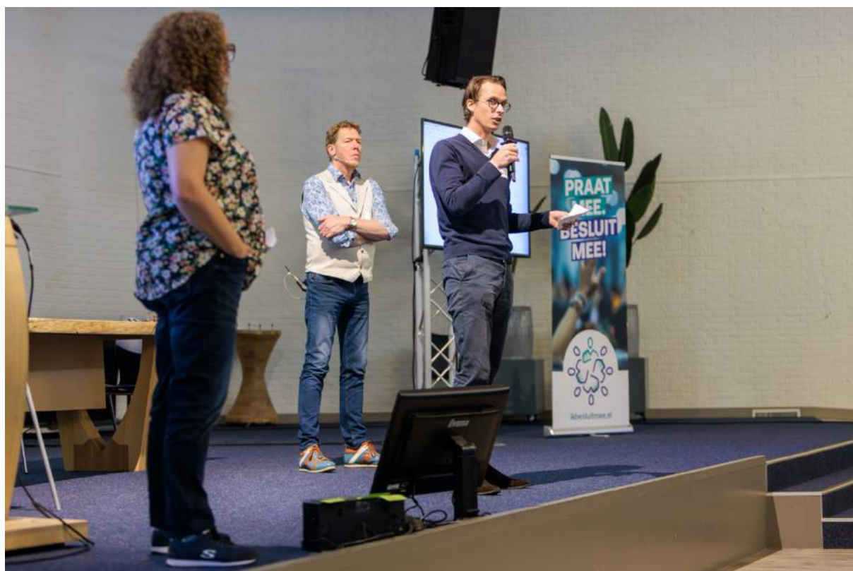
Uitleg geven over initiatief aan de oostkant van het gebied.