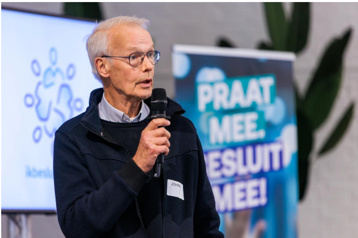
Presentatie van initiatief.