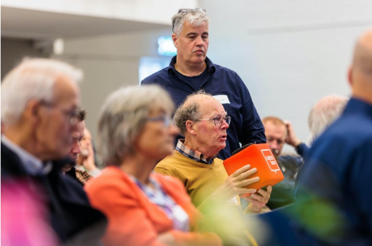
Met elkaar in gesprek.