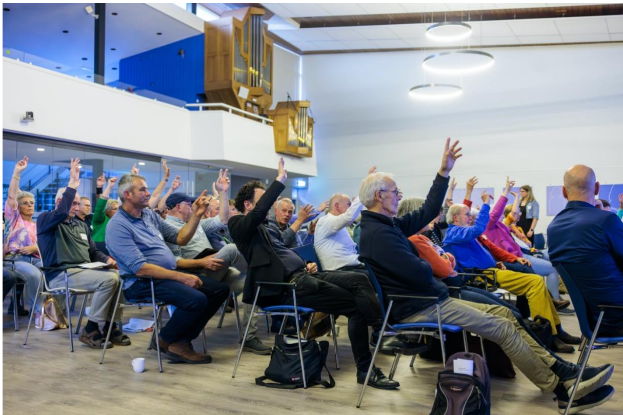
Wie kan met het voorstel leven?