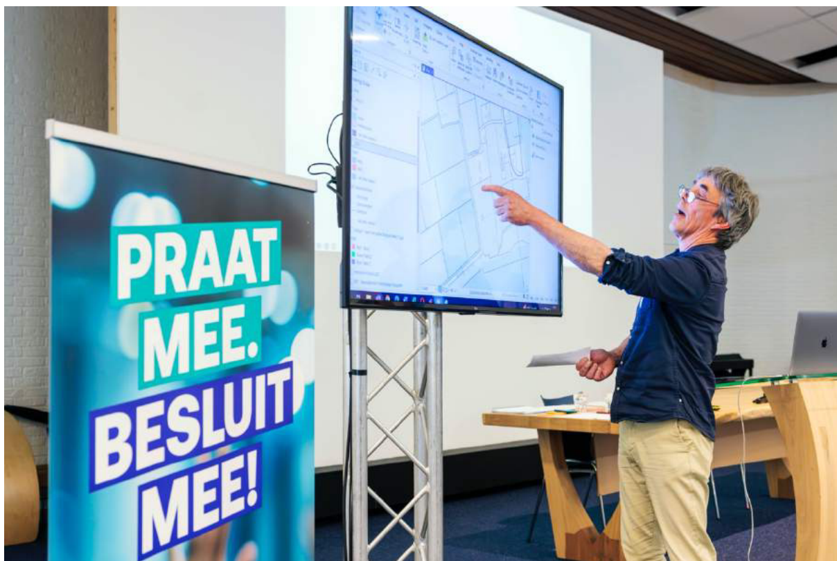
Aanwijzen plek op de kaart van het initiatief.