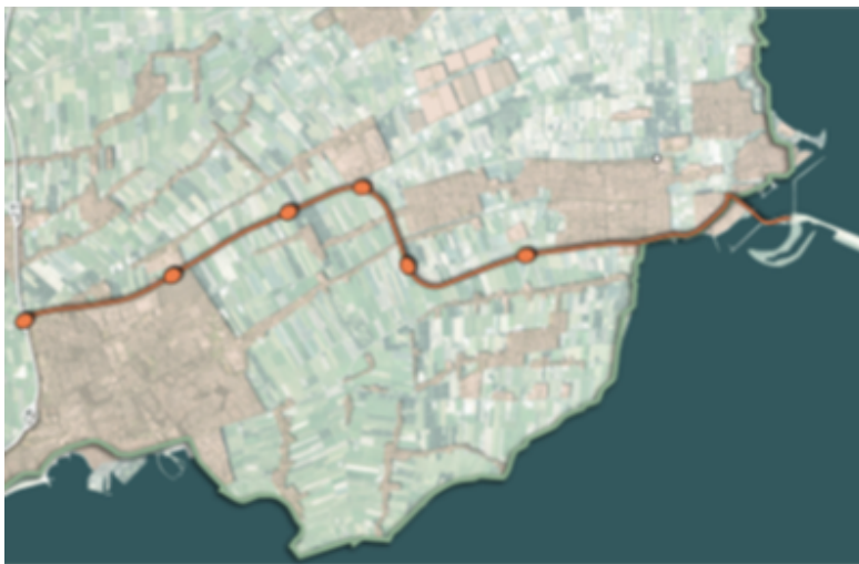
Plan gebied N307

Onderstaand een overzicht van het plangebied en de betrokken knooppunten langs de N307.