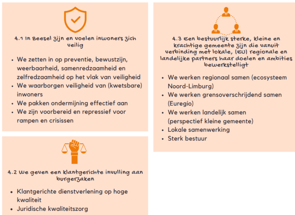
Afb. Doelenboom programma 4

Met het programma 4 - Veilige en Dienstverlenende gemeente - zorgen we ervoor dat onze inwoners zich veilig voelen in onze gemeente, dat onze inwoners een goede dienstverlening van ons ontvangen en zetten we in op een bestuurlijk krachtige gemeente, lokaal, (eu-)regionaal én landelijk. In programma 4 werken we aan de volgende doelen uit onze doelenboom: