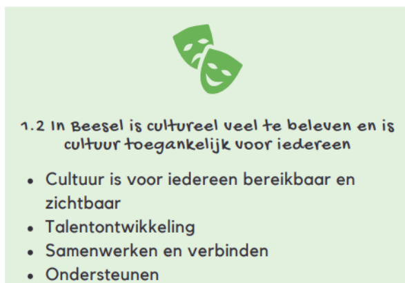
Afb. Doelenboom programma 1