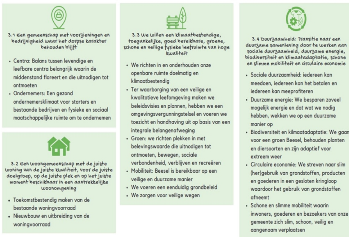
Afb. Doelenboom programma 3

In programma 3 werken we aan een omgeving waarin het fijn wonen, werken en recreëren is. Dit doen we door te zorgen voor een gemeenschap waar het bedrijfsleven de ruimte krijgt om te ondernemen. Dit zien we terug in de centra, de bedrijventerreinen en in ons waardevolle buitengebied. Ook zorgen we voor een prettige woongemeenschap. Belangrijk aandachtspunt is een aanbod van de juiste kwaliteit, voor de juiste doelgroep op het juiste moment. De meeste woningen waarmee we de toekomst in gaan staan er al, deze verdienen dan ook grote aandacht. Gelijktijdig werken we aan nieuwe woningen als waardevolle aanvulling op de bestaande voorraad. Zowel het wonen, werken en recreëren doen we in een klimaatbestendige, toegankelijke, goed bereikbare, groene en schone leefomgeving. Hiermee stimuleren we ontmoeting, beweging, sociale verbondenheid, verblijf en recreatie. Dit doen we door een juiste inrichting en onderhoud van de openbare ruimte. Dit alles doen we met aandacht voor duurzaamheid. Zo werken we aan een goede omgeving en samenleving en wentelen we de negatieve gevolgen zo min mogelijk af op de volgende generaties of andere delen van de wereld. Naast fysieke duurzaamheid, zoals afname van uitstoot van broeikasgassen, werken we ook aan sociale duurzaamheid. Dit betekent dat iedereen kan meedoen, iedereen het kan betalen en mee kan profiteren. In programma drie werken we aan de volgende doelen op basis van onze doelenboom: