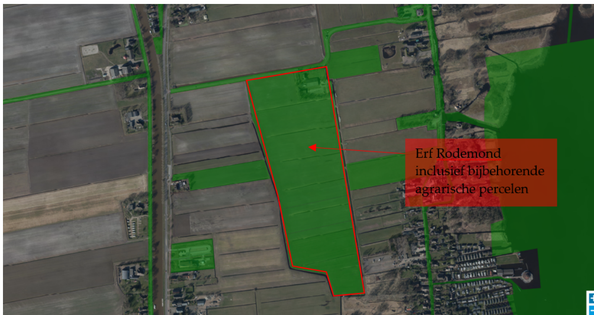
Giethoorn Zuid (de groen gearceerde gebieden zijn in eigendom gemeente)