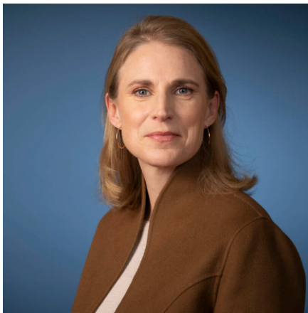
Minister VRO Elanor Boekholt-O'Sullivan

'In het coalitieakkoord hebben we afgesproken dat "water- en bodemsturend" een richtinggevend principe is. Ik snap de behoefte om duidelijkheid te krijgen over de invulling van dit richtinggevende principe. Ik zal daarom samen met mijn collega van lenW zorgen voor een heldere duiding en aangeven wat dit betekent voor de ruimtelijke opgaven in de Nota Ruimte. Daarmee zorgen we ervoor dat de juiste afwegingen worden gemaakt en dit niet zal leiden tot onnodige beperkingen voor ruimtelijke ontwikkelingen.