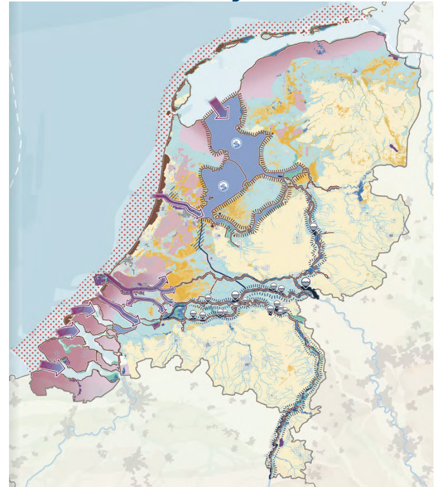
Integrale themakaart Water en bodem