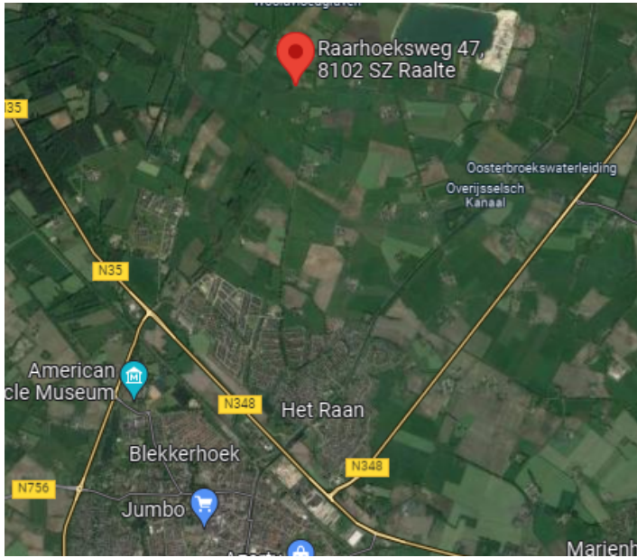
Afbeelding 2: luchtfoto omgeving