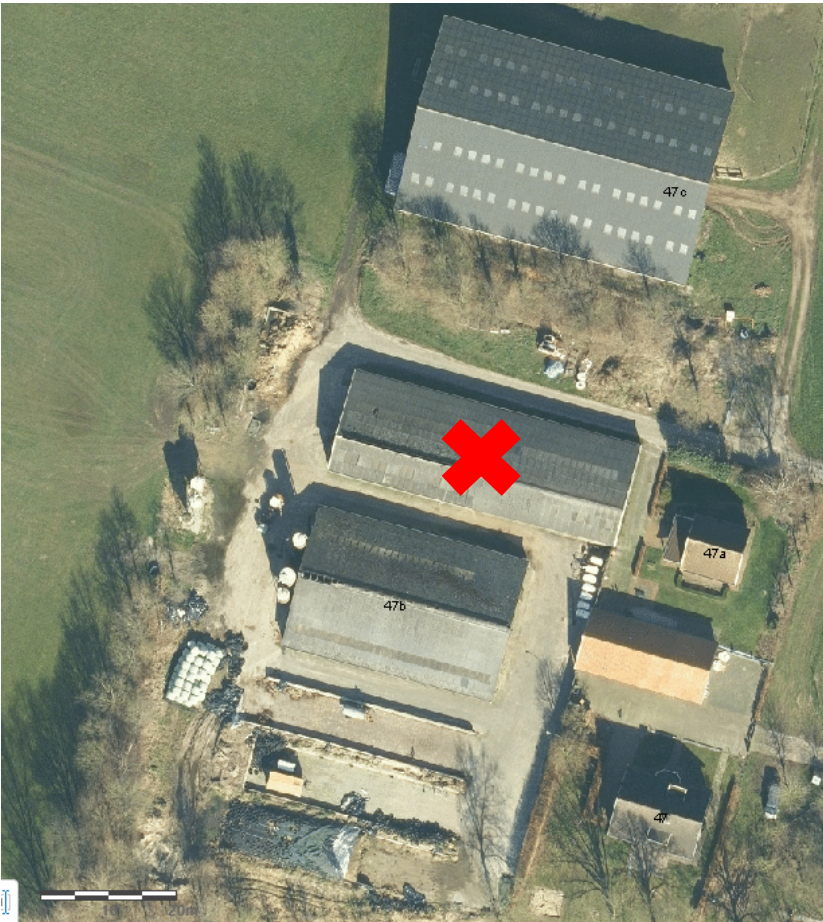
Afbeelding 1: luchtfoto Raarhoeksweg 47/47a/47b/47c (met rode kruis het gebouw dat gesloopt wordt)

Binnen de bestemming Recreatie – Verblifsrecreatie – 1 ontbrak het bouwvlak. Omdat recreatiewoningen alleen binnen het bouwvlak mogen worden gerealiseerd, wordt het bouwvlak alsnog toegevoegd.