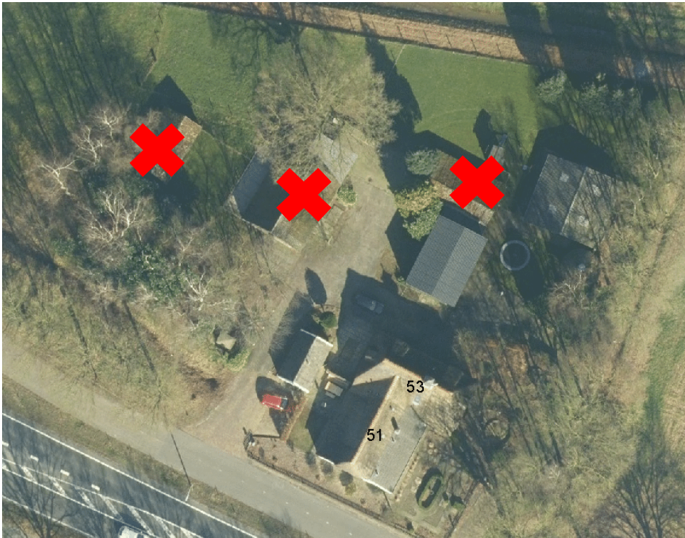
Afbeelding 4: te slopen schuren bij Nijverdalseweg 51/53 Mariënheem