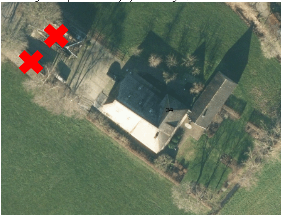
Afbeelding 5: te slopen schuren bij Linderteseweg 34 Raalte