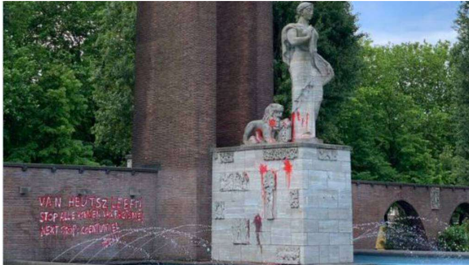
Het bekladde monument Indië Nederland op de Apollolaan.