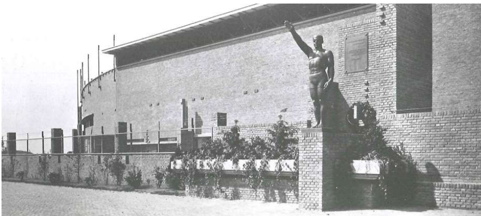
De Olympische Groet/Van Tuyll-monument bij het Olympisch Stadion in vroegere tijden.

Het beeld is geplaatst bij de Olympische Spelen in 1928. Kunstenaar Gerarda Rueb heeft een sportman met een gestrekte rechterarm afgebeeld, in de veronderstelling dat dit de Olympische groet verbeeldde. Omdat het beeld nadien vooral met het fascisme en nazisme werd geassocieerd, wat tot protesten leidde, heeft de eigenaar (VvE Olympisch Stadion) na historisch onderzoek in 2022 besloten het beeld uit de publieke ruimte te halen en in het trappenhuis van het stadion te plaatsen. Dit is een voorbeeld van de handelingsoptie 'verplaatsen'.