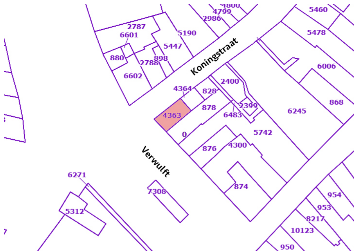
Ligging van het pand Verwulft 1 met het kadastrale perceel