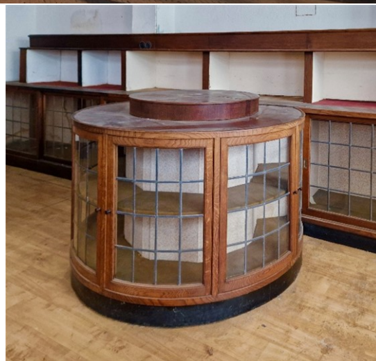
Verwulft 1, februari 2026