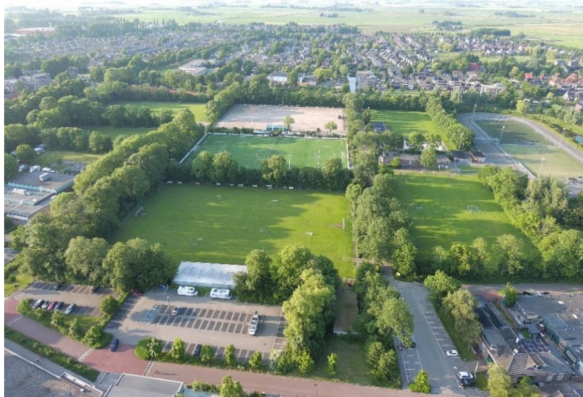
Figuur 1, vooraanzicht het Hart van Bolsward

Het is een ambitie van Bolsward en de gemeente om van het bestaande sportcomplex in Bolsward een levendig en groen sportpark te maken. De basis van deze ambitie is verwoord in de gebiedsvisie 'Het Groene Hart van Bolsward, van sportcomplex naar Sportpark', die op 8 juli 2021 door raad positief is beoordeeld. De uitwerking van deze gebiedsvisie is in volle gang.