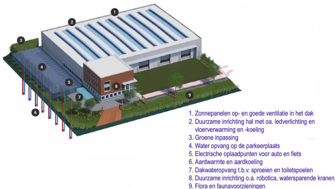
Figuur 4, referentiebeeld uit gebiedsvisie voor duurzame accommodatie

Op deze manier kan worden gewerkt aan brede welvaart door bij te dragen aan leefbaarheid en omgevingskwaliteit (de twee pijlers van 'geluk' van Súdwest-Fryslân). Maar ook aan duurzaamheidsdoelstellingen door (een) nieuwe accommodatie(s) in de ontwikkelzone. In de gebiedsvisie is Figuur 4 daarvoor als referentiebeeld gebruikt.