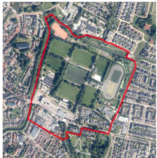
Figuur 2, gebied Hart van Bolsward

De raads- en commissieleden, die aanwezig zijn geweest bij bijeenkomsten over het Hart van Bolsward op locatie, hebben kunnen ervaren dat de huidige accommodaties sterk zijn verouderd en vernieuwd moeten worden.