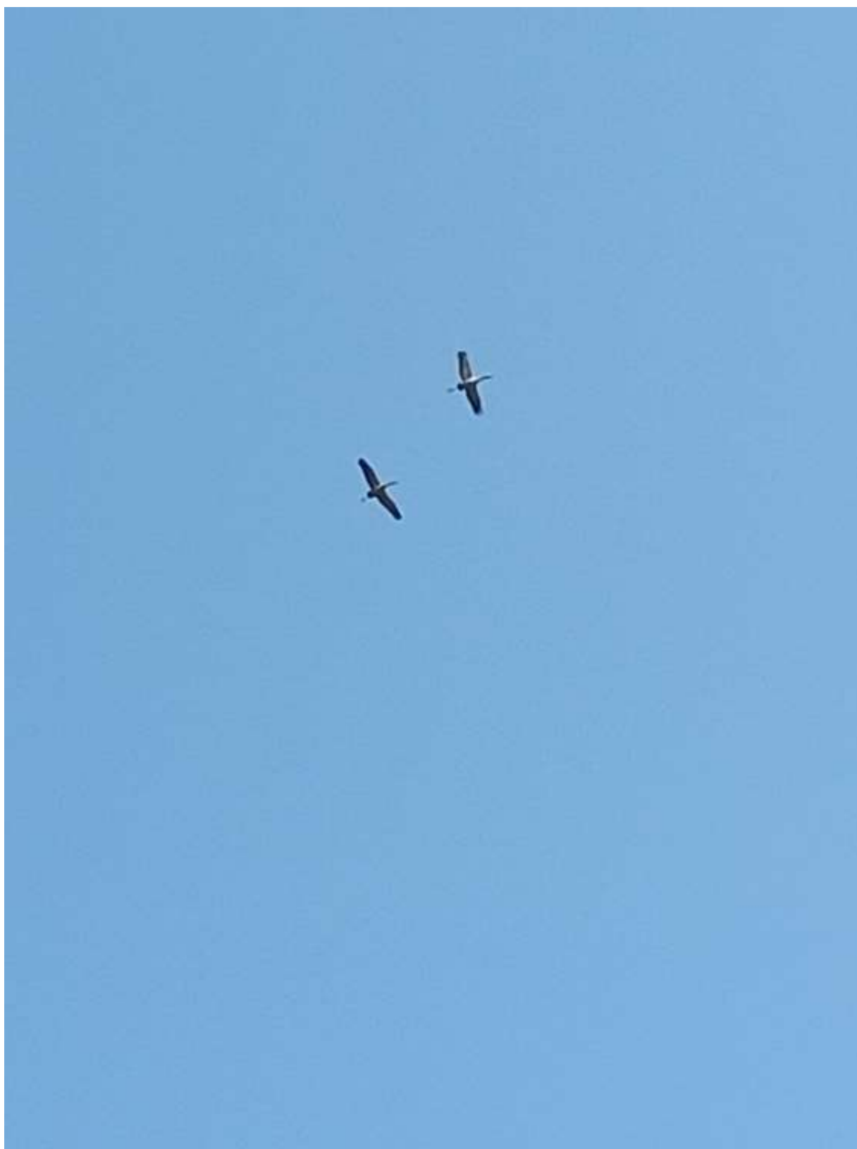
Bijlage 9 - Kraanvogels boven de Sponturfwijk 9 maart 2025.