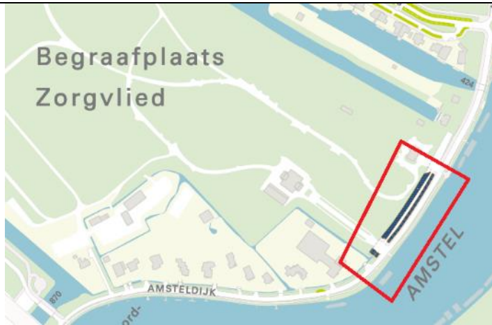
2 Begraafplaats Zorgvlied