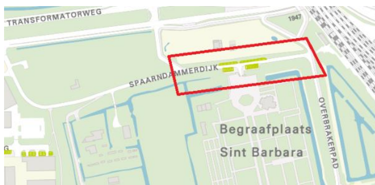
1 Begraafplaats Sint Barbara

Het gaat hierbij om een regime met betaald parkeren van ma-za van 09:00-21:00 uur; eerste 3 uur €1,60 per uur daarna €3,90 per uur. Bij deze locaties zijn uitsluitend parkeervergunningen geldig die in de hele stad geldig zijn. Dit gaat in het overgrote deel van de gevallen om parkeervergunningen voor gehandicapten (Deze vergunningen kunnen niet in geldigheid beperkt worden).